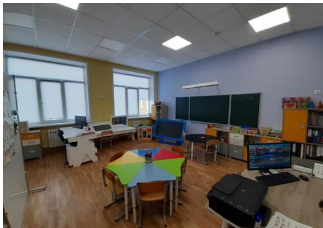
Кабинет учителя-логопеда № 2-14

Кабинет оснащен коррекционно-развивающим оборудованием: