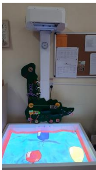
Кабинет сенсорной интеграции № 2-1.