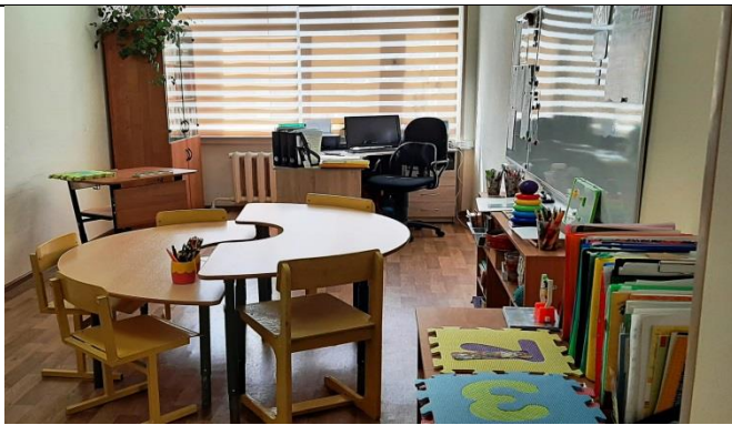
Кабинет учителя-дефектолога № 1-35