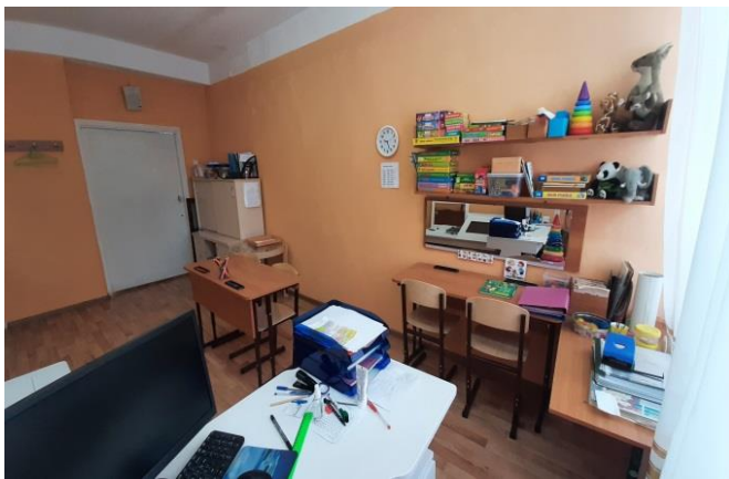
Кабинет учителя-логопеда № 2-39