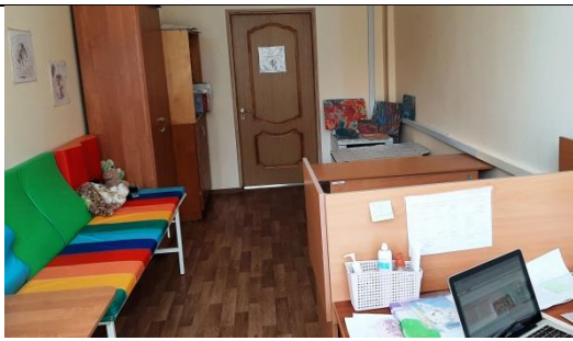
Кабинет педагога-психолога № 1-34.

4) материалы по диагностике обучающихся.