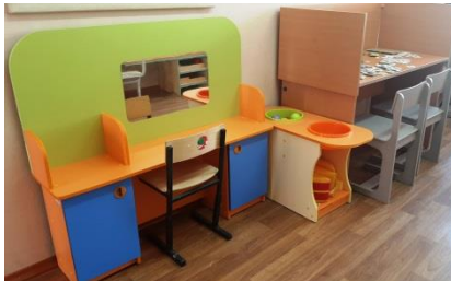
Кабинет учителя – дефектолога № 2-37