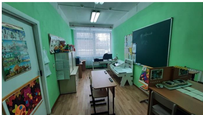
Кабинет учителя-логопеда № 2-39